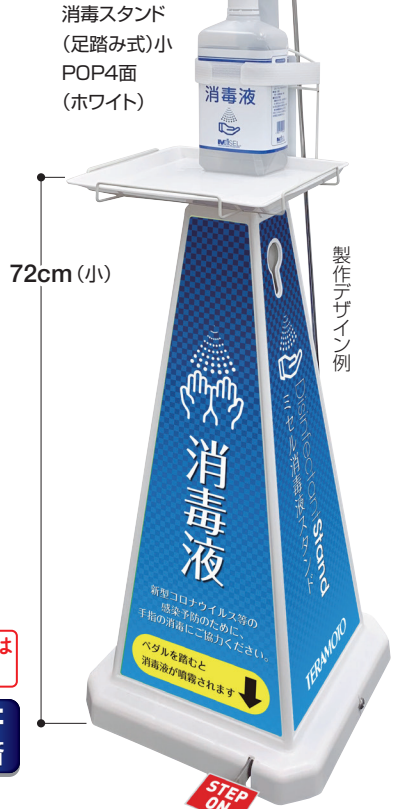
消毒スタンド (足踏み式)小 POP4面 (ホワイト)